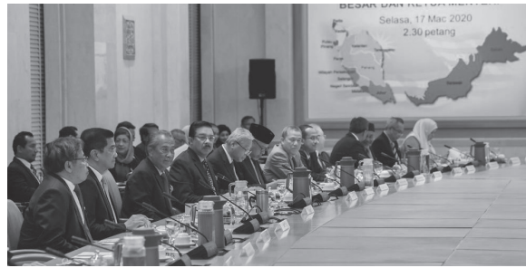
Sumber: Bernama, 17 Mac 2020

28 Gambar berikut menunjukkan suasana mesyuarat Menteri Besar dan Ketua Menteri.